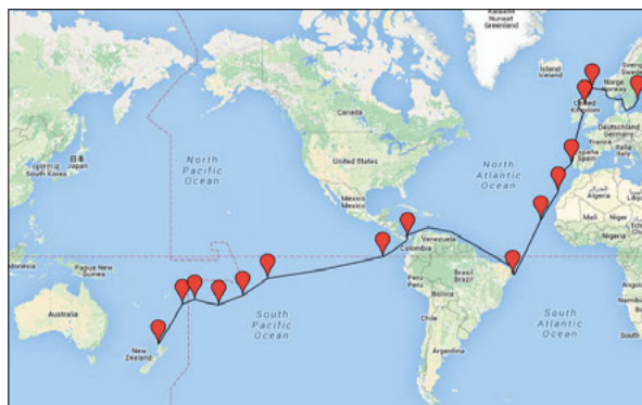
Följ med på resan via http://nerthusbloggen.se/

elska Kanalen och dess öar. Under sista natten innan vi siktade Dover passerade vi en skog av gasplattformer och vindkraftverk. Inte utan att det var lite dramatiskt att i kolmärker segla utmed rader av vindkraftverk i medström och en halv vind på ca 15 ms. Sark var en säregen och fin ö men erbjöd en hemsk ankring där swellen studsade mellan klipporna och natten blev enormt gungig och bullrig då vågorna smällde i överhängen i aktern.