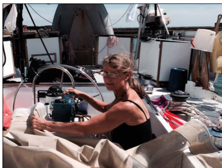
Några sömmar i sprayhooden hade rämnat. Nu helt o fint igen!