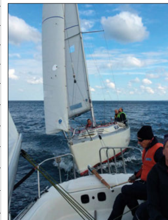
Tät fight mellan Expresserna på väg söderut