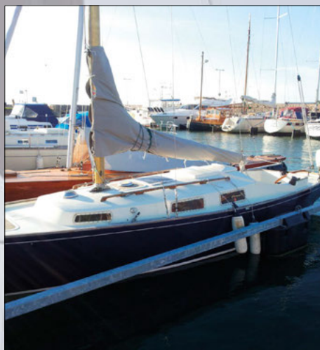
...och så här fin blev hon efter lackningen!